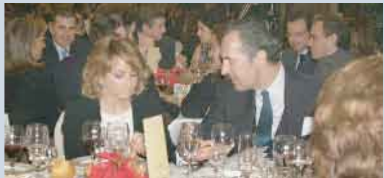
Nuestros invitados disfrutaron de la cena.