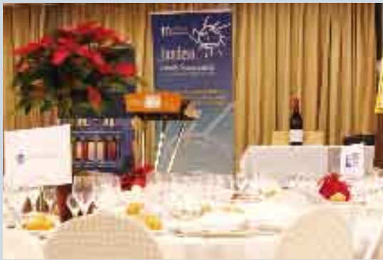
Aspecto general del salón en Madrid.