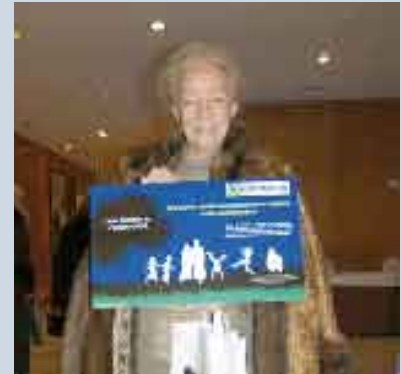
La ganadora del premio de Euromaster.