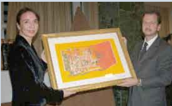
Ganadora del premio más valorado de la subasta: Un estupendo cuadro de Gaspare Manos.