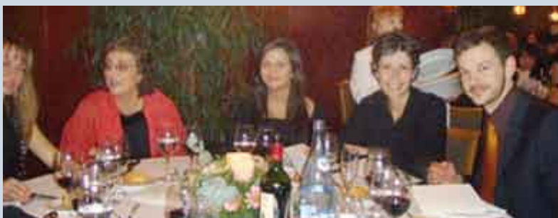
Donantes y amigos de Fundeso durante el acto en Barcelona.

En Barcelona, el VII Sopar Benèfic de Fundeso Catalunya contó con la asistencia de 200 personas. Directivos, ejecutivos, políticos, amigos y colaboradores de Fundeso compartieron esta cita. Cuatro empresas solidarias pusieron mesa corporativa y más de 50 donantes nos acompañaron virtualmente a través de la fila 0.